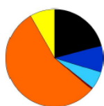
Abb. Unser gesamter Unternehmensmix für 2018

Gemäß § 42 des Energiewirtschaftsgesetzes vom 03.08.2011; weitere Informationen unter http://www.bundesnetzagentur.de