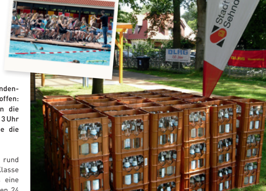
Ein Kubikmeter Getränke wurde von uns gespendet.

Weil die KGS Partnerschule von Hannover 96 ist, brachte der Verein auch eine Torschusswand mit. Darüber hinaus gab es Sportangebote wie Volleyball, Boxen, Fußball, Tanzen, Seilspringen, Kistenklettern – natürlich auch einen Arschbombenwettbewerb. 24 Stunden können ganz schön lang werden, deshalb fand den ganzen Tag über ein Musikprogramm statt, zum Teil fast im Wasser. Die Schulorchester spielten auf der Insel mitten im Schwimmerbecken, die Schüler- und Lehrerbands auf einer Bühne.