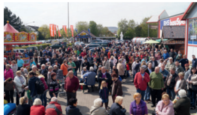
Da war was los – bei der Neueröffnung im April.

Viel Erfahrung, stetige Weiterbildung, kunden- und preisorientiertes Denken gepaart mit einer einzigartigen Servicepalette machte das BHS Bauzentrum zu dem was es heute ist – einer der größten ortsansässigen Arbeitgeber mit dem richtigen Warensortiment sowohl für Profi- als auch Privatkunden.