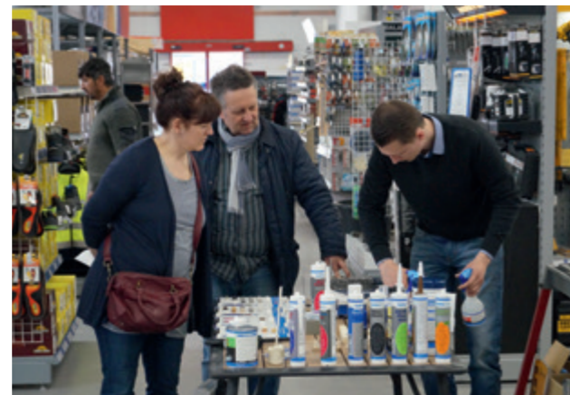
Auf die persönliche Kundenberatung wird großen Wert gelegt.

Als Mitglied einer der größten und leistungsstärksten Fachhandelskooperationen, der Eurobaustoff, kann das BHS Bauzentrum durch Umsatzbündelungen von über 1250 Fachhandelsbetrieben entsprechende Einkaufsvorteile zum Vorteil seiner Kunden nutzen. Weit über 4.800 Transportfahrzeuge im Dienste der Eurobaustoff – vom Kleinbus bis zum 38-Tonner mit Ladekran und Hubwagen – garantieren einen schnellen Lieferservice.