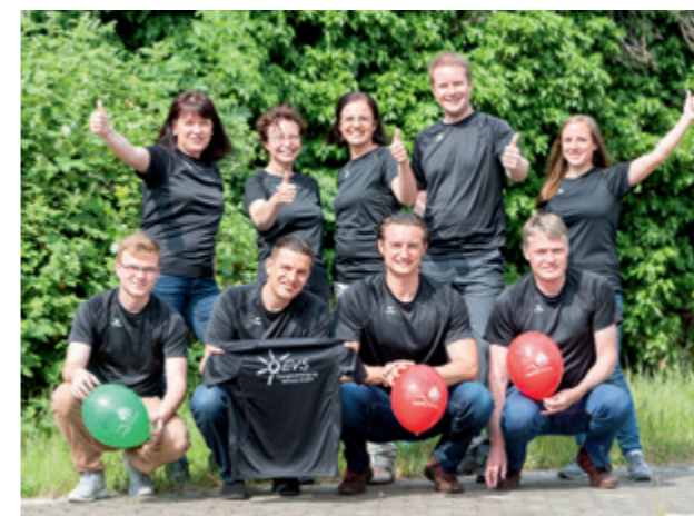
Zum ersten Mal sind wir mit dabei beim Hannover Firmenlauf – hier ein Teil unserer Mannschaft.

Beim 12. Hannover Firmenlauf sind wir dieses Mal mit dabei! Da heißt es: anfeuern und Daumen drücken!