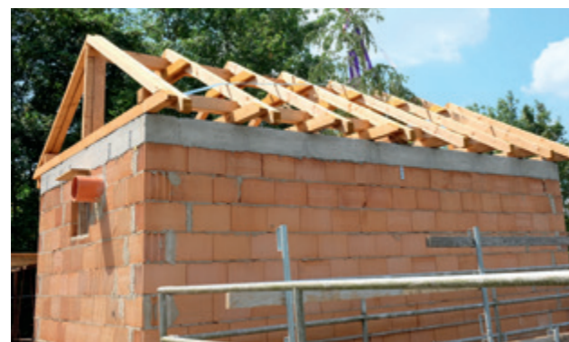
Der Pumpwerksoberbau erhält eine Verschalung aus Lärchenholz.

Anfang Juli verschickt der Netzbetreiber Avacon spezielle Postkarten, auf denen unsere Kunden die abgelesenen Strom- und Gaszählerstände eintragen und portofrei zurück senden können. Die Zählerstandserfassung kann aber auch online auf der Avacon-Homepage vorgenommen oder per Smartphone über den gedruckten QR-Code übermittelt werden.