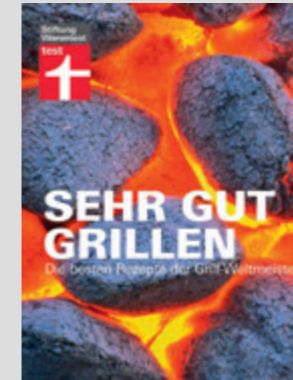
Grillen wie die Weltmeister.

Sehr gut grillen: Die besten Rezepte der Grill-Weltmeister