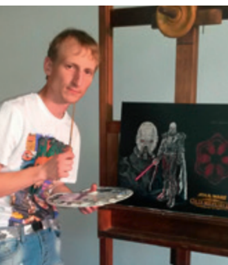
Dieses Star-Wars-Bild hat sich sein Sohn gewünscht.

Der Grünkolonnenführer, seit August 2007 für die Stadtwerke tätig, ist als gelernter Gärtner der Fachmann im Team. Vor allem, wenn es um allgemeine Garten- und Grünflächenpflege geht oder bei speziellen Themen wie Kettensägearbeiten und Wildkrautbekämpfung.