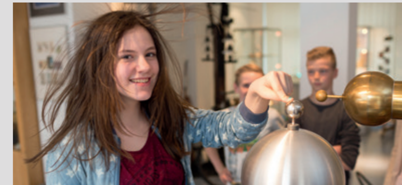
Bei diesem Experiment stehen dank Elektrizität die Haare zu Berge.

Das Staunen über die technischen Details und die Erkenntnis, dass sich in jeder Erfindung auch stets ein Stück Sozial- und Zeitgeschichte widerspiegelt, machen den besonderen Reiz dieser im Jahr 1979 gegründeten Ausstellung aus. Besonders die alltäglichen Geräte, die so mancher Besucher noch aus der eigenen Anwendung kennt, faszinieren oder regen zum Schmunzeln an. Zum Beispiel frühe elektrische Brotröster, nostalgisch anmutende Staubsauger, Holzbottichwaschmaschinen oder Heißluftduschen, die man heute als Föhn kennt.