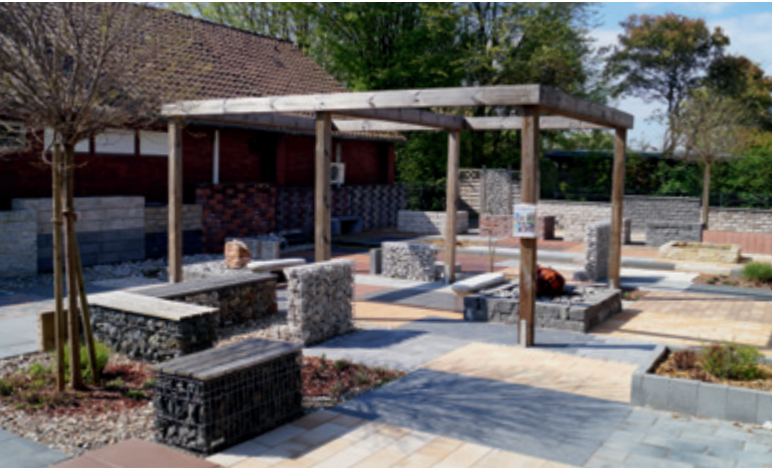
Auch in puncto Gartengestaltung gibt es viel zu sehen.

Unser Kunde BHS Bauzentrum: ein spannendes und innovatives Unternehmen