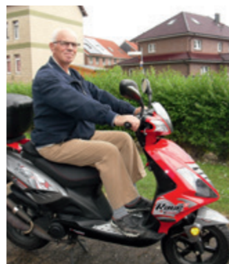
Flott unterwegs – hier mit der Explorer Race GT 50.

Seit Mai 2011 „der Mann für alle Fälle“ bei den Stadtwerken – der gelernte Maurer kümmert sich zwar auch um die Grünpflege, aber natürlich hauptsächlich um die Maurer- bzw. Klinkerarbeiten und ums Pflastern. 2014 war er für den kompletten Hoch- und Klinkerbau des Anbaus der Pumpstation Köthenwald zuständig. Sein großes Hobby sind Motorroller – damit erledigt er alle Wege: von der Arbeit bis zum Einkaufen.