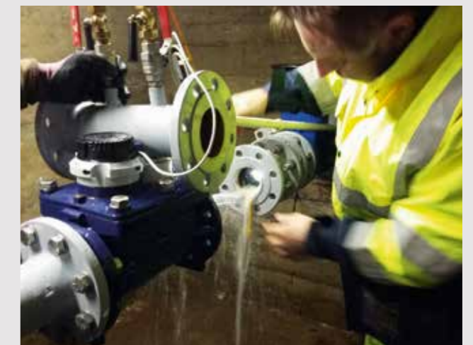
In diese Öffnung passte der „Pipe-Inspector“.

So funktioniert sie: Die Kamera schwimmt batteriebetrieben ohne Kabel frei im Wasserstrom des Leitungssystems und liefert aus dem Inneren der Rohrleitung kontinuierlich Daten zur Zustandserfassung der untersuchten Leitungsstrecke – ohne Aufgrabungen oder Rohrtrennungen. „Pipe-Inspector“ ermöglicht eine materialunabhängige und lückenlose optische sowie akustische Untersuchung von Transportleitungen. Im Unterschied zu kabelgebundenen Inspektionssystemen arbeitet dieses Verfahren kabellos, wodurch die kontinuierliche optische Untersuchung langer Leitungsabschnitte von bis zu 50 km erst möglich wird. Auch schwer zugängliche Rohrleitungen lassen sich damit untersuchen. Dank einer Druckbeständigkeit bis 100 bar können auch Kraftwerksleitungen, z. B. vor deren Erstinbetriebnahme inspiziert werden.