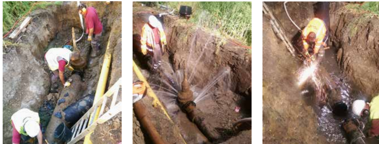
Vor Evern wurden die Trinkwasserleitungen freigelegt – und in der Nacht dann ein Schieber zurückgebaut bzw. alte Formteile modernisiert.

Die Übernahme der Leitungen kostete einen mittleren sechststelligen Betrag und war im September 2016 besiegelt worden. Für die Sehnder Bürger änderte sich jedoch nichts – der Wasserpreis blieb stabil.