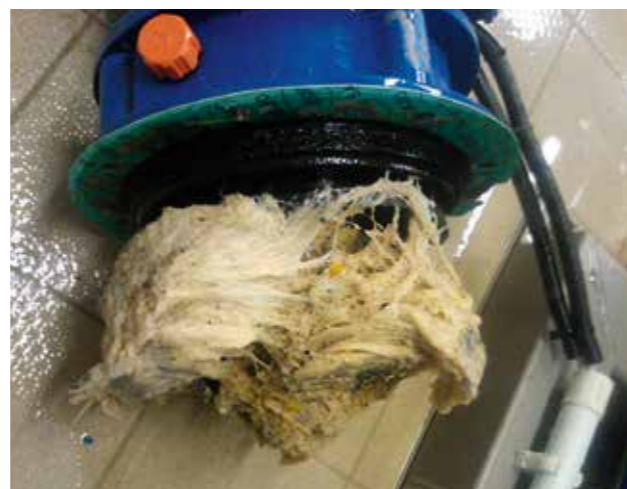
Lange Zöpfe aus Feuchttüchern bringen die Pumpen zum Stillstand.